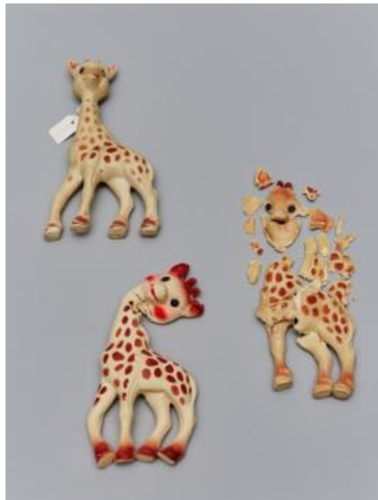
Sofie de giraffe, collectie RCE.

Elke collectie hedendaagse kunst en design bevat tal van voorwerpen die geheel of gedeeltelijk van plastic zijn gemaakt. Om de samenstelling van de voorwerpen te kunnen identificeren is specialistische kennis nodig, die vaak niet aanwezig is in musea zonder laboratorium. Het Plastics Project richt zich op toegepast onderzoek voor deze grote groep voorwerpen en brengt natuurwetenschappers en niet minder dan tien grote musea en collectiebeheerders in Nederland bij elkaar. Doordat het project een do-it-yourself methode ontwikkelt kunnen beheerders en restauratoren in de toekomst zelf een groot deel van hun plastics collecties identificeren, monitoren en waar nodig conserveringsmaatregelen treffen. De Rijksdienst voor het Cultureel Erfgoed (RCE) leidt bovendien twee jonge professionals op, die zich specialiseren in dit vakgebied. Het project start op 3 april 2017 en loopt tot april 2019. Het wordt financieel ondersteund door het Gieskes-Stribis Fonds en het Mondriaanfonds.